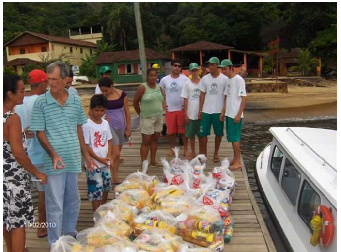
Cais na Enseada do Bananal