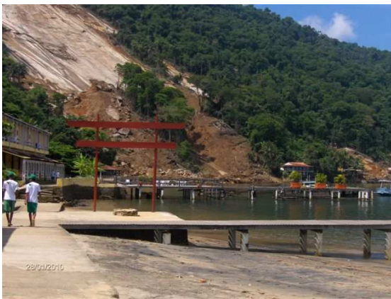
Enseada do Bananal